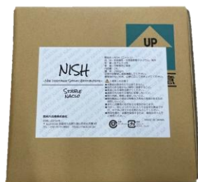
NISH 除菌消臭スプレー詰め替えBOX 5L・20L BOXの2種