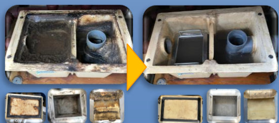
グリーストラップ